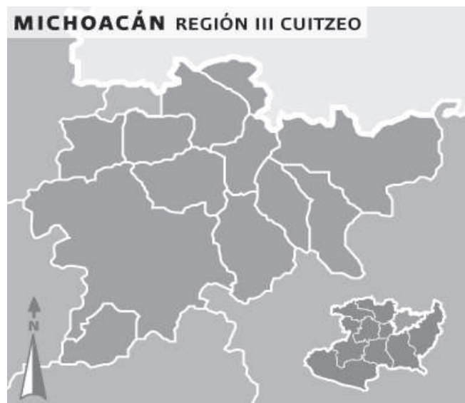
Mapa 1. Región Cuitzeo.