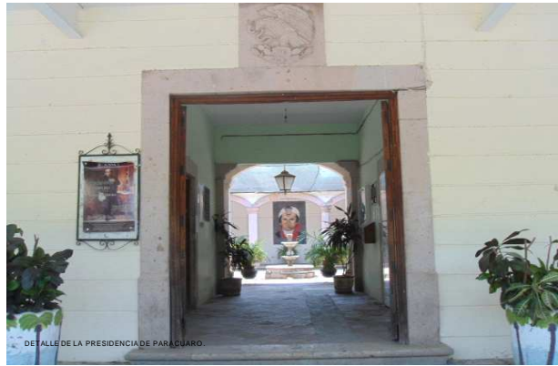
PLAN DE DESARROLLO MUNICIPAL SUSTENTABLE DEL MUNICIPIO DE PARÁCUARO MICHOACÁN 2012-2015.