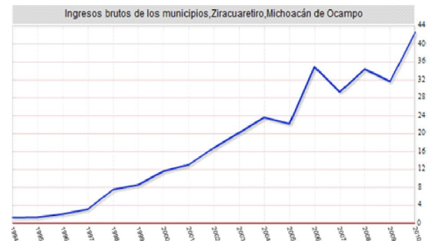
Ingresos brutos de los municipios, Ziracuaretiro, Michoacán de Ocampo