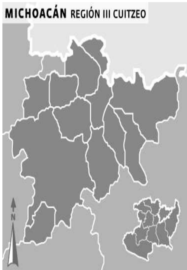
Mapa 1. Región Cuitzeo.

En el siglo XIX, de acuerdo con la Ley Territorial de 1831, Copándaro formó parte del Municipio de Cuitzeo, en calidad de tenencia. El 31 de diciembre de 1949, se le dio la categoría de Municipio, llamándosele, Copándaro de Galeana.