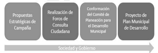
Figura 1: Proceso de elaboración del Plan Municipal de Desarrollo

El presente Plan Municipal de Desarrollo, toma como base principal la incorporación de la visión política y de desarrollo propuesta durante la campaña electoral por el Presidente Municipal y su equipo de gobierno. Los compromisos establecidos durante la campaña, así como las propuestas realizadas por la ciudadanía conforman la esencia del presente plan de desarrollo.