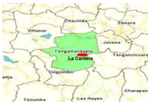
Imagen 3: Localización y Colindancias de La Comunidad Cantera Michoacán

La comunidad indígena de la cantera se localiza al noroeste del estado de Michoacán, a 167 kilómetros de Morelia.