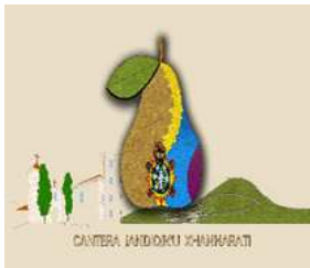
Imagen 2: Escudo del Consejo Comunal de La Cantera.

Los colores verde, azul, amarillo y morado son los colores que representan a la bandera p'urhepecha y junto a ellos su escudo representativo y por ultimo las palabras» LA CANTERA JANDIOJKU XHANARATI «lo que en su traducción tendría varios significados muy parecidos que son los siguientes; la cantera caminara sola, la cantera examinara sola, por mencionar algunas; todo este.