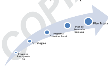
Imagen 1. Estructura de planeación en México

Para lograr que este plan fuera eficiente de acuerdo con el desarrollo que se requiere actualmente de las comunidades, se siguió el siguiente esquema de planeación, de esta manera se guardó congruencia con los propósitos nacionales y estatales para el desarrollo.