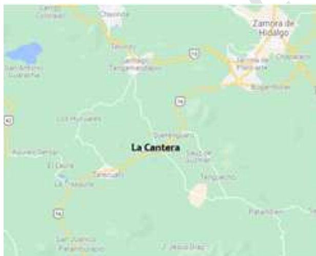
Imagen 4: Ubicación De La Comunidad De La Cantera.

Colinda al norte con los municipios de Tangamandapio, Villamar, Chavinda, Zamora; al este con los municipios de Jacona y Tangancicuaro; al sur con los municipios de Tangancicuaro y Tinguindín; al oeste con los municipios de Tinguindín y Villamar