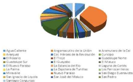
Distribución de Población por comunidades

2.3.5 Migración: La principal causa de migración en el Municipio, es la falta de fuentes de empleo y oportunidades de desarrollo, por lo que actualmente se registra un porcentaje de migración de 5.03 % de la población en base al conteo INEGI 2021, siendo el destino principal el país vecino Estados Unidos de Norteamérica, además de tener una población en crecimiento de flujo migratorio a poblaciones dentro del territorio nacional entre las que destacan San Francisco del Rincón y Moroleón, Guanajuato, Guadalajara, Jalisco, Zamora, Uruapan y Morelia, Michoacán.